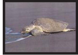
Una tortuga de la especie baulas

Varias agrupaciones medioambientales han organizado una “gran carrera de tortugas”. Once tortugas hembras de la especie baulas han iniciado el lunes su camino entre el Pacífico de Costa Rica, y la islas Galápagos (Ecuador).