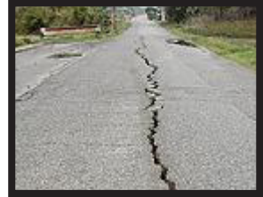
Grieta en la carretera, consecuencia de unos de los sismos

Los servicios de emergencia en Chile están preocupados por la salud mental de casi 35.000 personas. Viven en una zona que ha sufrido una ola de sismos. Desde finales de enero han registrado miles de temblores en Puerto Aysén y Puerto Chacabuco, en el sur del país.