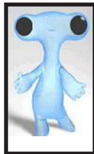
Mascota de la Expo 2008

La organización de la Expo Zaragoza 2008 ha convocado un concurso público. Piden la composición del himno de la muestra internacional. El elegido va a conseguir 85.000 euros. El plazo de la presentación de las propuestas finaliza el 30 de abril. La decisión definitiva del jurado va a ser el 14 de mayo.