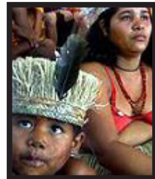
Indígenas del Amazonas

El principal organismo de derechos humanos en América Latina ha ordenado al gobierno peruano una rápida actuación. Es necesario para proteger a las tribus aisladas del Amazonas de los leñadores que entran de forma ilegal en sus territorios.