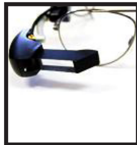
Parte de las gafas que permiten ver subtítulos

Las gafas reciben la señal de un ordenador que hay en la sala y la proyecta en una micropantalla. Pueden funcionar durante 3 horas y son muy fáciles de utilizar.