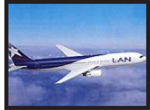
Un avión de Lan Chile

Un avión de la aerolínea chilena Lan Chile casi choca la semana pasada con varios objetos incandescentes cuando ha preparado su aterrizaje en el aeropuerto de Auckland, Nueva Zelanda. Piensan que estos objetos pueden ser parte de un satélite ruso que ha entrado en el espacio aéreo neozelandés.