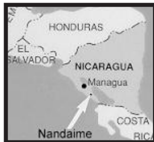
Situación de Nandaime, en Nicaragua

Allí le han entregado su primer certificado de nacimiento, pero lo ha perdido en un viaje en 1933. En 1970 han desaparecido todos los archivos en un incendio. Ahora la justicia le pide requisitos que no puede cumplir.