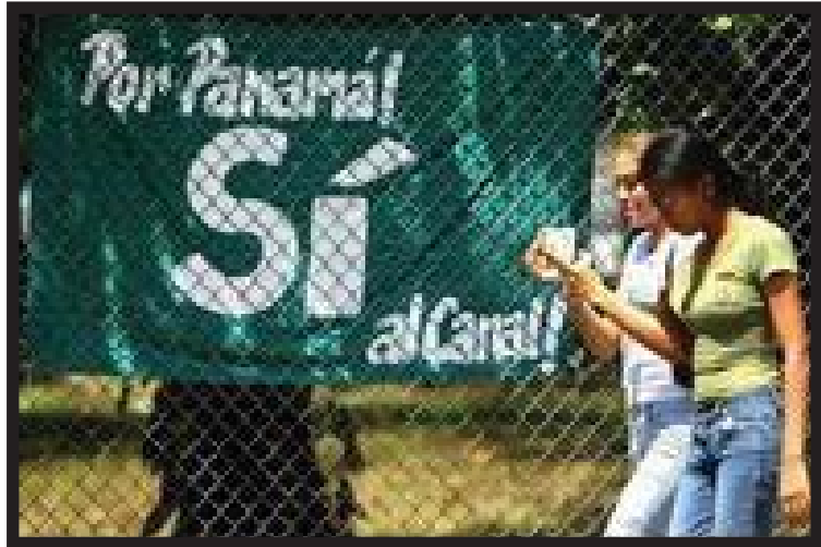
Cartel de propaganda a favor del sí

El pasado domingo en Panamá ha tenido lugar un referéndum. El objetivo ha sido decidir sobre la ampliación del Canal de Panamá, una de las mayores obras de ingeniería del mundo. Los panameños han dado una respuesta clara.