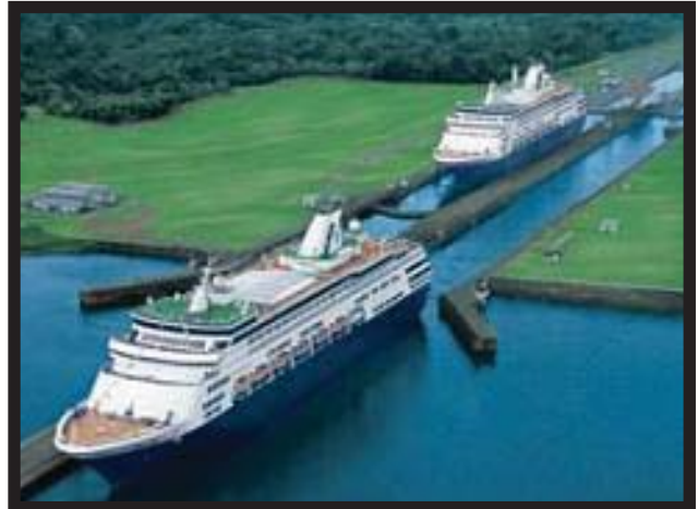
Imagen del Canal de Panamá

Nicaragua está planeando un proyecto gigantesco: un canal que va a unir el Océano Atlántico y el Océano Pacífico. El presidente de Nicaragua, Enrique Bolaños, lo ha anunciado en la VII Conferencia en Defensa de las Américas.