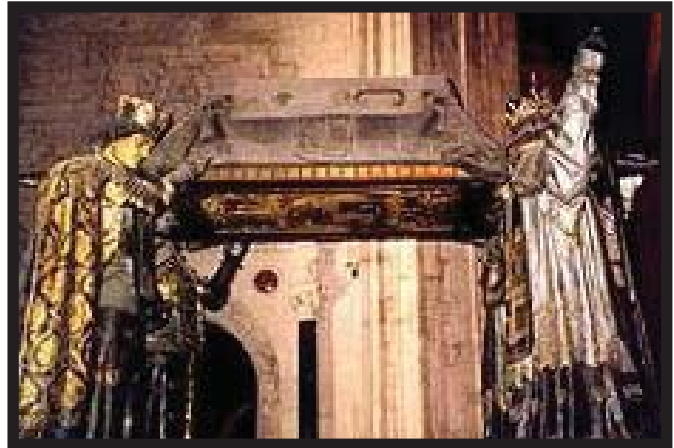
Tumba de Colón en Sevilla

E n la República Dominicana han organizado numerosas actividades para celebrar el Día de la Hispanidad, que recuerda el descubrimiento de América. En el Faro a Colón (Santo Domingo) tienen lugar misas, conferencias y conciertos.