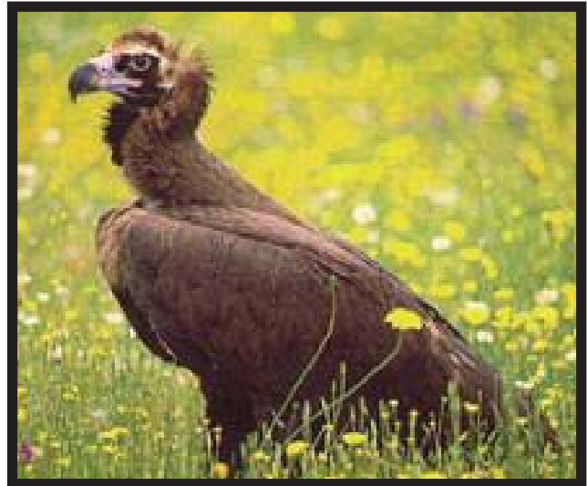
Un buitre negro

M adrid y Extremadura han regalado seis buitres negros a la Reserva Nacional de Caza de Lleida. Van a crear una colonia en la zona del Pirineo. Durante un tiempo los seis buitres van a estar en grandes jaulas. Así pueden conocer la zona y los van a liberar en los próximos años.