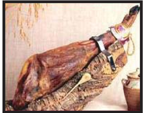
Un jamón ibérico de bellota

E l abogado y sus amigos han conocido el jamón ibérico en una visita a Madrid hace dos años. Exportar productos españoles a Estados Unidos va a representar una enorme oportunidad para las empresas españolas del sector alimentario.