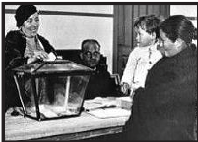
Una mujer vota por primera vez en España

E l pasado domingo las mujeres españolas han celebrado el 75 aniversario de la primera vez que han podido votar. El 1 de octubre de 1931 el Gobierno ha redactado la Constitución de la II República. Han tenido un fuerte debate sobre el tema, pero finalmente han aprobado el voto de la mujer.